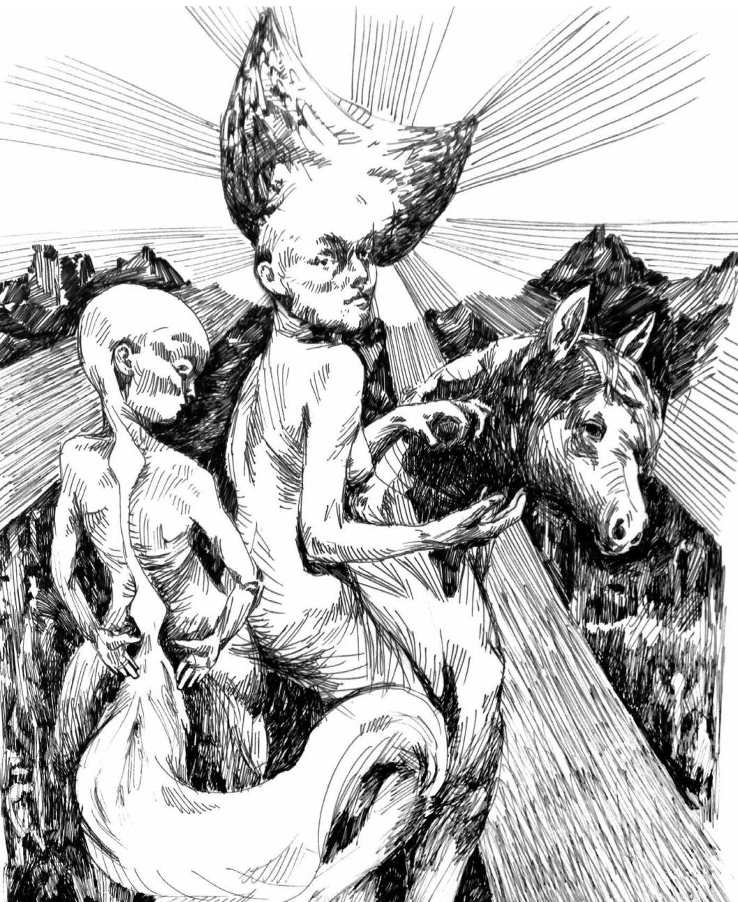
Ilustrace Erika Čičmanová