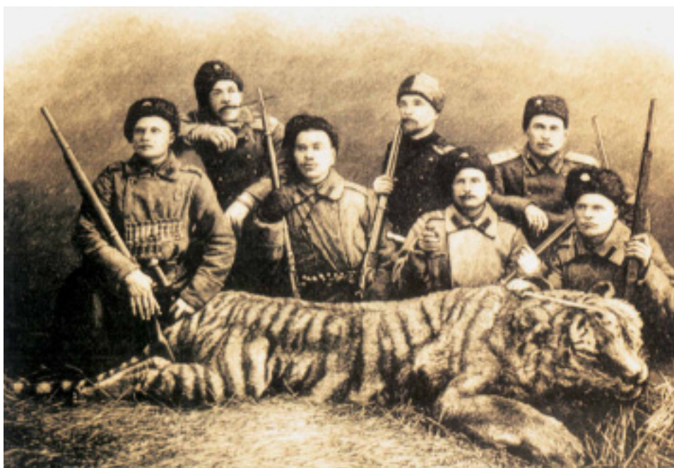
Na lovu, kolem roku 1885.