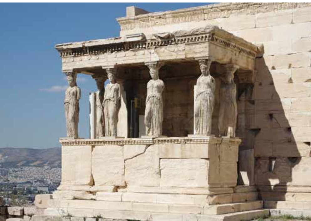
Obr. 8 Erechtheion v Athénách, 421–406 př. Kr.

kosti a mýtotočrné zajímavosti nedosáhli, až na Alexandra a jeho následovníky, ale to už šlo – snad s výjimkou Alexandra, jehož postava byla považována za nadlidskou asi upřímně – o pochlebnictví dvorních mýtotočrnů; za jednoho z nich byl považován i Augustův Vergilius. Teprve s odstupem času vznikaly z příběhů historických osobností nové mýty. Různý je vlastní podíl na rozhodování hrdinů: Odysseus jednal více ze své vůle než Aeneas, etruští zakladatelé měst uskutečňovali bez jakékoli diskuse vůli bohů.