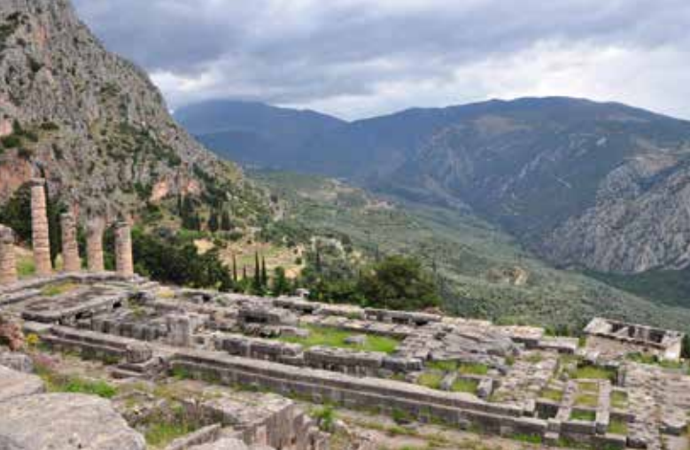
Obr. 2 Apollónův chrám v Delfách, 4. století př. Kr.