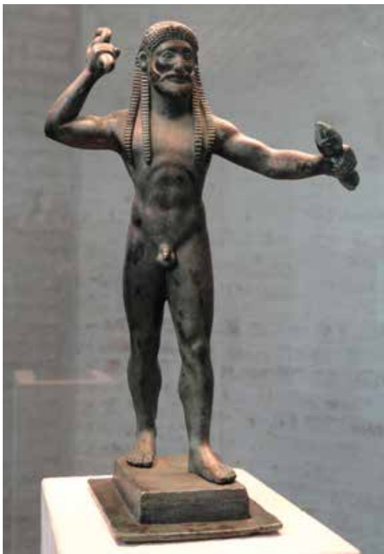
Obr. 7 Zeus vrhá blesky, archaický bronz, 530–520 př. Kr.

k městskému státu či římskému impériu, podobně jako podepisování manifestů loajality či účast ve volbách za vlády komunistů. Židům a křesťanům ovšem vadilo i to, co ostatní Římané považovali za nepřilíš podstatnou formalitu.