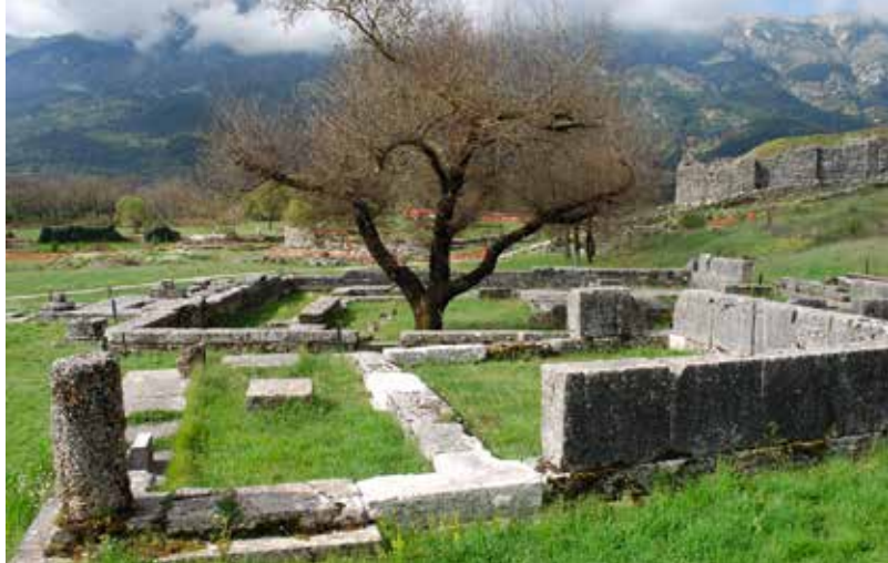
Obr. 3 Diův chrám v Dódóně, 4. století př. Kr.

i mimo vlastní řecký svět (jako Olympia, hlavní město mírového setkávání, či Apollónův Délos); a konečně nejvýše stály mysterijní svatyně, kde byli ti, kdo k tomu dozráli, zasvěceni do hlubších vrstev náboženského poznávání (mýty byly obvykle jejich předstupněm).