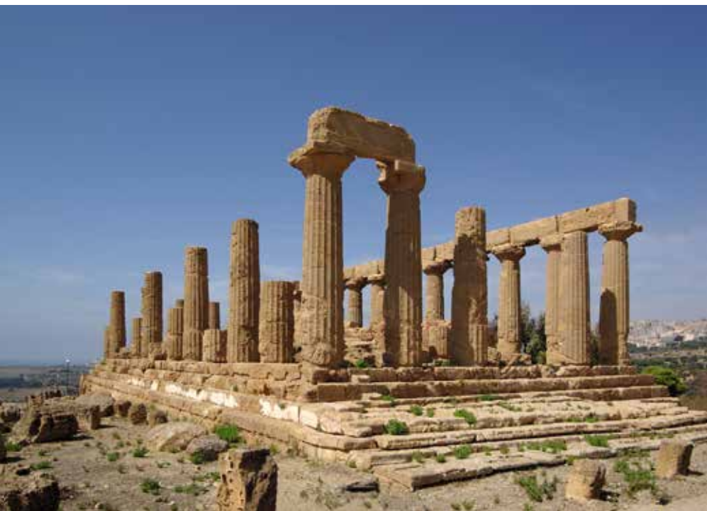
Obr. 10 Hérin chrám v Agrigentu, Sicílie, 550 př. Kr.

Založení města bylo vždy rituálním aktem. Město muselo být vymezeno (to, že Remus přskočil brázdy obvodu Říma, byla pro účastníky obřadu potupa a zároveň dostatečný důvod k pochopení bratrovraždy) a jeho střed musel být středem nového lidského světa, spojeného se světem božským. Tento jakýsi Jakubův žebřík byl právě ve středu nového města, kde se nacházel chrám (nebo tzv. centrální dvůr krétských paláců); rituálně stanovený střed s Jakubovým žebříkem pak určil celé další členění města. Vedle chrámu byl již