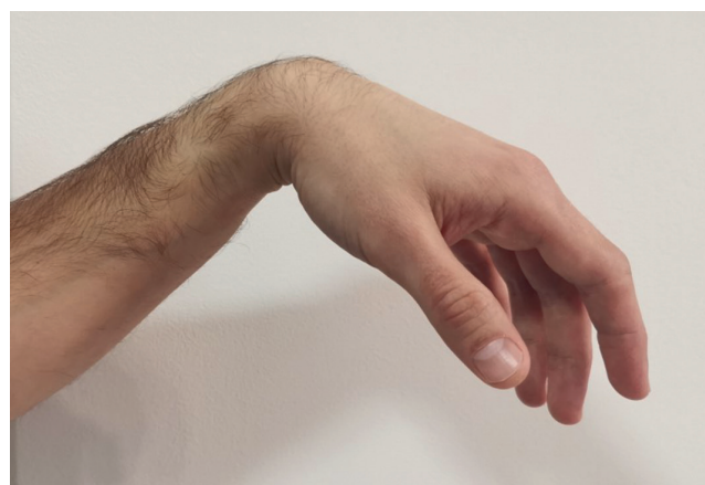
Obr. 43.19: Klinický obraz parézy n.radialis, tzv. syndrom „labutí šíje“